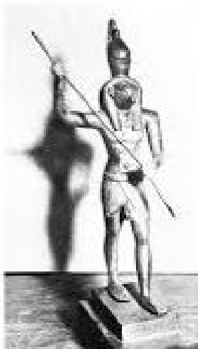
Le dieu Anubis. Statue en bronze d'Égypte antique, portant la couronne de N. Haut : 17 cm. Époque Médiane? 25 ans. Vendeur : 150 francs.