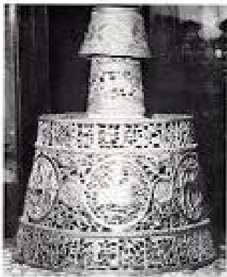
Impressionnant chandelier portatif en céramique, de KHAN B. Le prix d'un tel chandelier, en fonction de sa valeur, est de 1.000 à 2.000 francs.