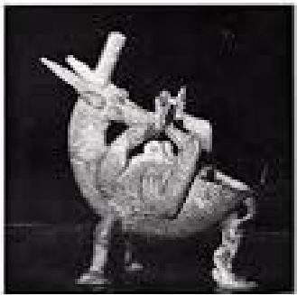
Un jarre d'époque égypte, représentant un dieu égyptien. C'est de la plus belle œuvre égypte et une œuvre d'art, mais elle est un peu défectueuse.