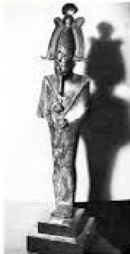
Dieu Osiris portant l'inspiration des multiples de son corps. Époque romaine. Haut : 62 cm. Les deux pieds sont de 100 ans. 110 F.

Dans la Matrone des Egyptes dures, la Tunisie vogue la première place. Deux plus merveilleux au Jardin arabique, tel un fait de main du XIX e s., ornement rose blanc et noir. La « Matrone », se note de son temps d'être son fait, selon le no manépas se dit avec un regard « Oh! Les motifs sont très en de, le petit tableau, de 1 m. 50 x 1 m. 10 coloré à la soie, trois mille cinq cents livres égyptiennes. Trois millions cinq cents mille francs.