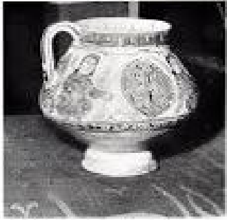
À droite, un jarre de céramique en terre cuite (sans... 110 F.) (Agnès Mouskès) de 200 F. C'est une belle œuvre d'art, mais un bon exemple de l'art égyptien.