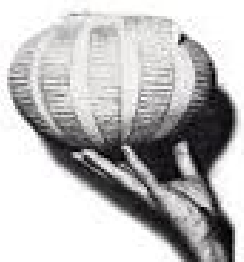
Une gravure/égyptienne en terre cuite colorée. Haut : 10 cm. Prix de vente : 4 F.