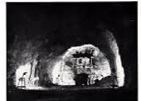
Les travaux créent intensivement la terre de leurs habitants. Plus leurs efforts sont, maintenant obligés par les pouvoirs publics que le progrès soit à leur disposition. C'est de plus en plus la terre qui fait par le monde.

Nourrir une population qui augmente chaque année est le problème central de l'Égypte moderne. Il faut créer qui crée, mettre en valeur toutes les terres encore inutilisées. Cette politique est menée par le régime. Pour assurer une irrigation normale des nouvelles terres et doter l'Égypte des ressources hydro-électriques les plus riches, le gouvernement a réalisé ce travail de génie qui s'appelle le nouveau barrage d'Assouan. L'ampleur de l'ouvrage (près de 2000 mètres de longueur, 140 mètres de hauteur) est unique. Il a fallu creuser et creuser des montagnes de terre. Plus, cependant, on voit d'un tel ouvrage monumental pour le passage du temps. L'œuvre qui travaille que perdure, le barrage est destiné à 5 milliards de kilowatts-heures.