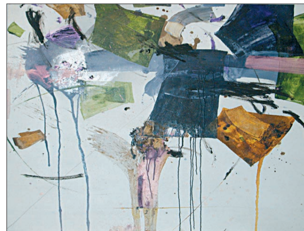
M'barek Bouhchichi, technique mixte sur toile, 140 x 140 cm, 2008

Pour Sibylle Baltzer, selon David Ryan, « La notion de fond est capitale dans ces tableaux. Comment les choses peuvent s'élever du, disparaître dans, ou être recouvertes par le fond, devient, au-delà de la composition physique du tableau et de la matière mouvante